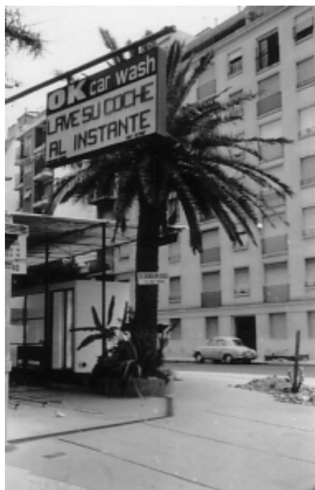
fig. 10 Un lavacoche se alza en el solar de la Casa de Rey Pastor en Yerbal 898, Buenos Aires.

Al morir Rey Pastor en Buenos Aires en febrero de 1962 muchas cosas cambiaron. La influencia que todavía ejercía en el medio universitario, pese al ostracismo a que estuvo sometido en los años anteriores, desaparece completamente sin que se sigan sus ideas en la elaboración de los nuevos planes de estudios (ideas recogidas en su correspondencia con Babini, Santaló y otros). Además desaparece su casa de Yerbal, a la que hicimos mención más arriba, y con ello su deseo de Fundación para estudiantes de matemáticas latinoamericanos. Este símbolo, que representaba cierta continuidad de la obra magistral de Rey Pastor, fue derribado físicamente para construir sobre su solar un lava coches con el sugerente nombre de «O. K. car wash».