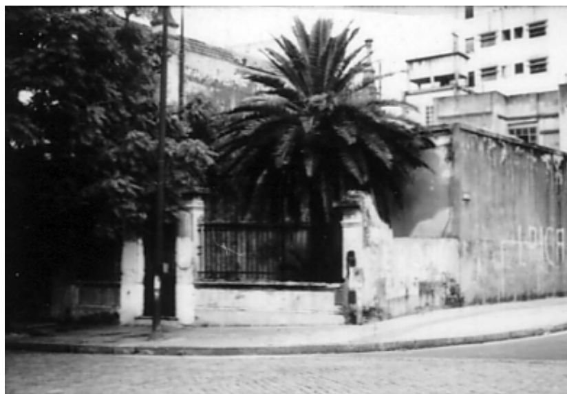
fig. 3 Casa de Rey Pastor en Yermal 898, Buenos Aires.

Merece la pena dedicar unas palabras a esta casa. Estaba situada en la calle Yermal 898, esquina a Añasco, entre el metro de Primera Junta (Línea directa a Plaza de Mayo muy cerca de Perú 222, donde estaba la Facultad de Ciencias), y la estación del ferrocarril de Caballito. Muy próximo estaba el Mercado del Progreso situado en la plaza de Primera Junta. Rey Pastor consideraba a aquella casa como el centro del Mundo, o al menos el centro de su mundo.