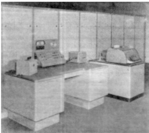
Fig. 5 La computadora Mercury de Ferranti de la U. de Buenos Aires

Fue elegida una Mercury de Ferranti, que llegó al puerto de Buenos Aires en noviembre de 1960 19 . En este momento no estaban preparados todavía los locales de la Universidad para alojarla, ni existía en la Facultad de Ciencias ninguna persona que tuviese experiencia en cálculo electrónico para manejarla y menos aún al tratarse de una máquina inglesa.