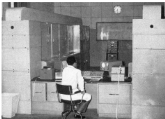
Fig. 1 La Computadora FINAC de Roma

El Istituto Nazionale per le Applicazioni del Calcolo, (creado en Roma en 1932) era un modelo para el recién creado en el CSIC de Madrid. Su director, Picone, y su subdirector, Ghizzetti, eran amigos de JRP. También Antonio de Castro, subdirector del IC, que había trabajado con Sansone en Florencia, conocía bien el INAC 9 . En el INAC se acababa de instalar una computadora Ferranti (la FINAC).